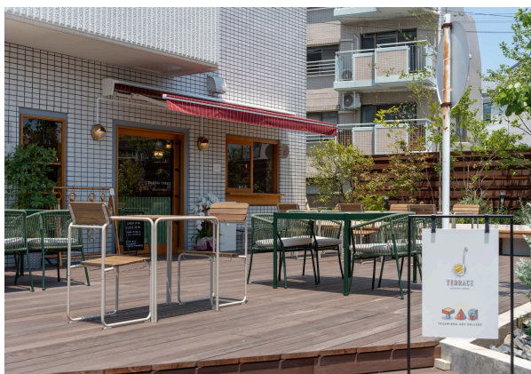
▲画像はエントランス（左上）、手紙社アートギャラリー（右上）、手紙社カフェ店内テラス（左右下）※営業時間は手紙社HPをご確認ください