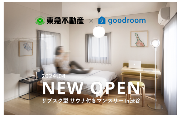
goodroom residence 渋谷道玄坂のイメージ

2024年4月末にオープンする東急不動産所有の賃貸マンションの再生プロジェクトや、竹中工務店より受託した旧社員寮3棟をグッドルームにて再生し24年秋に開業するなど、ゼネコン、デベロッパー等が当社でのリノベーションを前提に物件を取得したり、新築建替以外の選択をすることはこれまでにあまり無いケースでしたが、本来は投資対象として課題があった寄宿舍でも高利回りを期待できる物件として空き家活用に取り組んでおります。