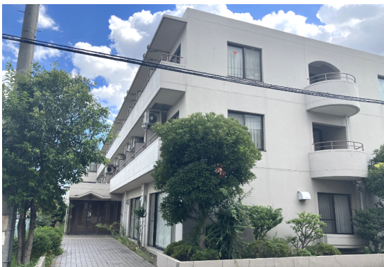
goodroom residence 越谷（仮称）の従前写真