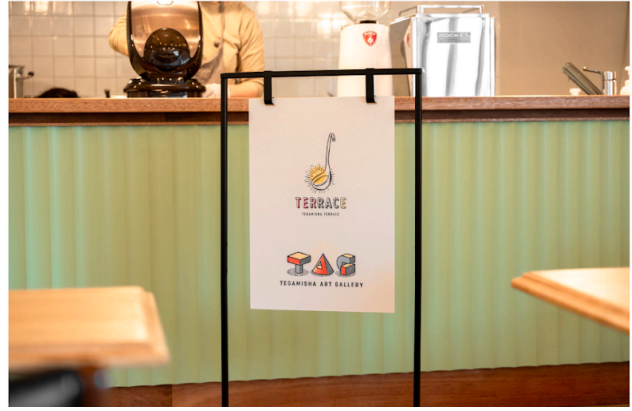
ギャラリー「TEGAMISHA ART GALLERY」