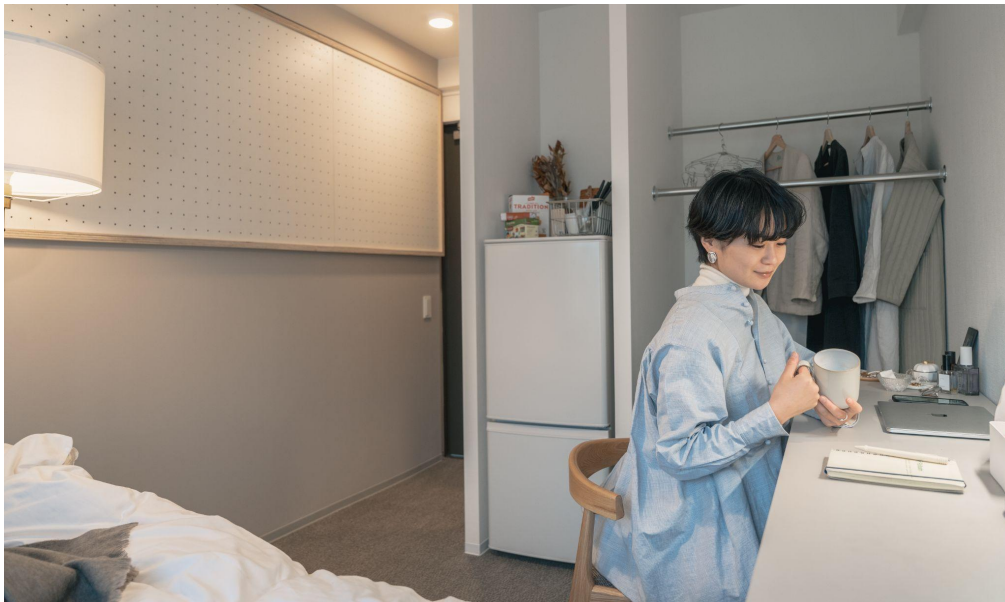
2023年4月にオープンしたライフスタイルレジデンス「TOMOS学芸大学」