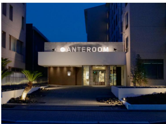
ホテルアンテルーム京都（京都・東九条）