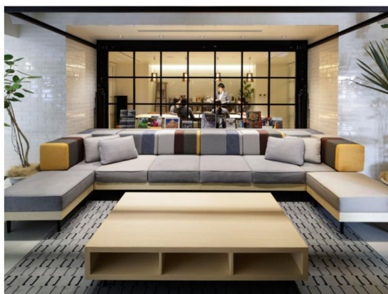
「ホテルエディット横濱」（横浜・馬車道）