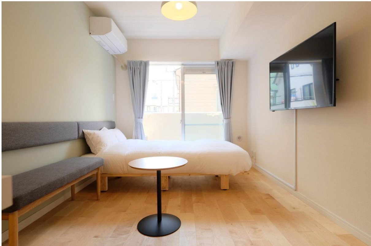
(TOMOS要町 モデルルーム)